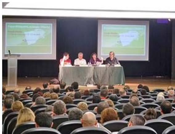
Imatge d'una de les taules rodones de l'Escola D'estiu

La cloenda de l'Escola d'Estiu amb la presentació de les conclusions va anar a càrrec del president d'ICV, Joan Saura.