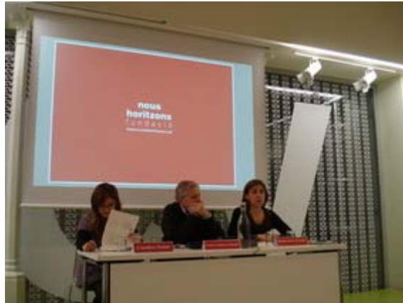
Imatge de l'acte de presentació