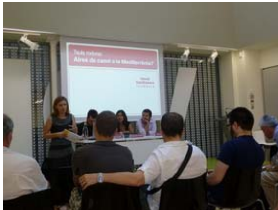
Imatge de la taula rodona "Aires de Canvi a la Mediterrània"