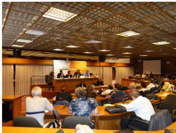
Imatge de les Jornades a Montevio