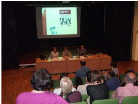
Acte de presentació de la delegació de la FNH a Sabadell