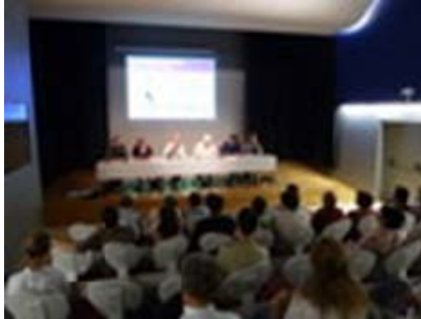
Imatge de l'acte de presentació del llibre del 50è aniversari de la Revista Nous Horitzons