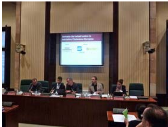
Jornada de treball al Parlament de Catalunya sobre la Iniciativa Ciutadana Europea.