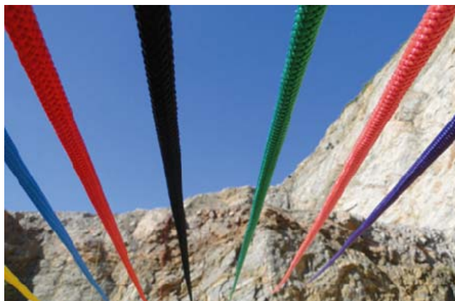
Imatge de la portada del llibre

Aquest llibre pretén analitzar els vincles entre el document i l'ètica ( en el cas concret, la fotografia com a testimoni dels crims). La voluntat de la Fundació Nous Horitzons és el d'ampliar cronologies i fronteres, el de mostrar com la lluita per la llibertat i l'emancipació ciutadana es innat a la condició humana. Dialogar amb la història de la rebel·lia, poder trobar la voluntat humana que ens lliga al compromís i a l'elaboració dels instruments per a defensar la llibertat, seran els objectius principals d'aquesta obra.