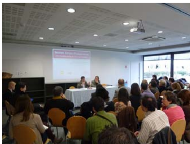
Imatge de la inauguració del seminari Una mirada verda als Serveis Socials

En cada una de les taules es va encetar un torn de col·loqui amb una gran participació per part del públic assistent.